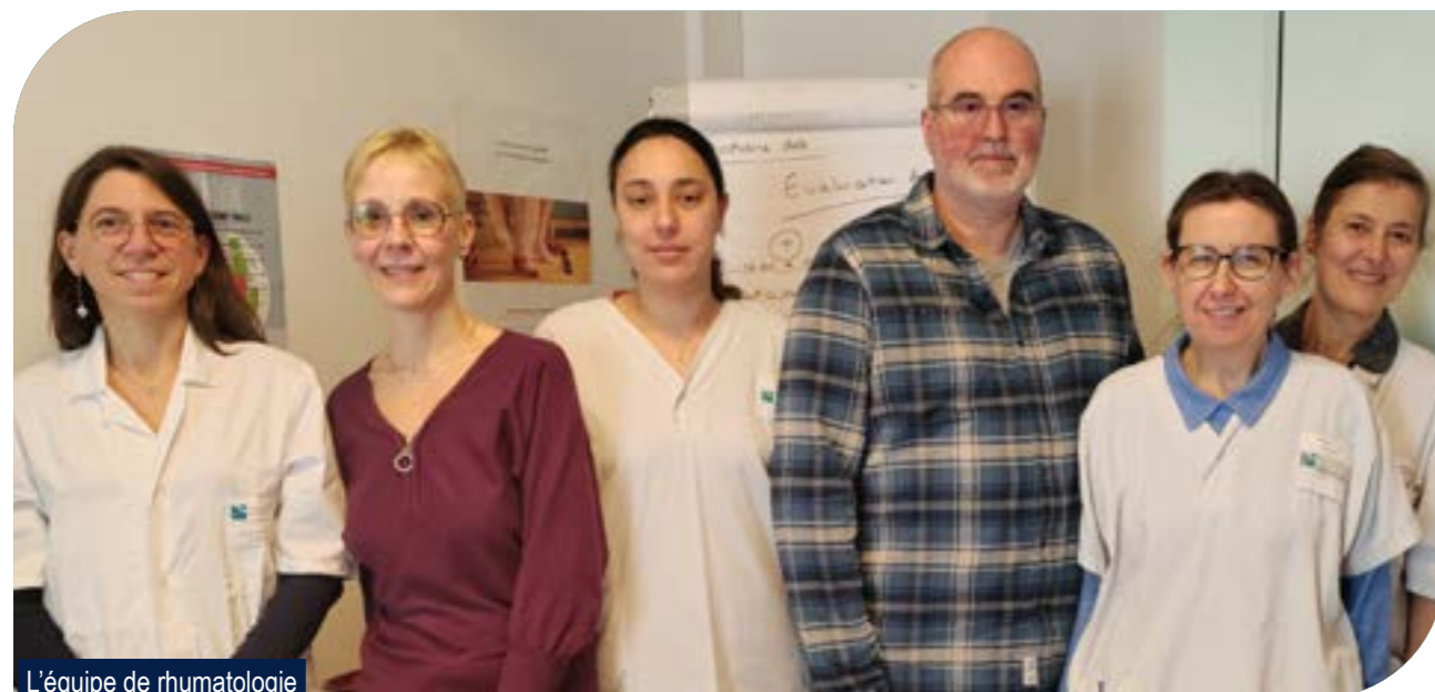
L'équipe de rhumatologie

Avoir un rhumatisme inflammatoire chronique comme la polyarthrite ou la spondylarthrite nécessite de multiples adaptations quotidiennes et l'acquisition de nombreuses compétences.